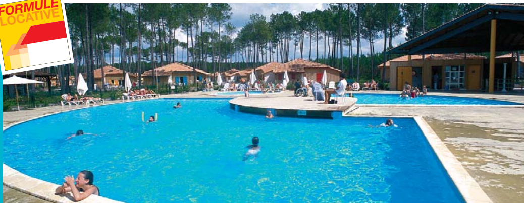
La piscine du Lac Marin

> Les services : réception, laverie automatique (payant), cabine téléphonique. > En juillet-août : bar, traiteur avec service de plats à emporter, supérette.