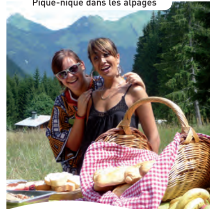
Pique-nique dans les alpages

Semaines thématiques originales à certaines dates. semaine PASSION Renseignez-vous !