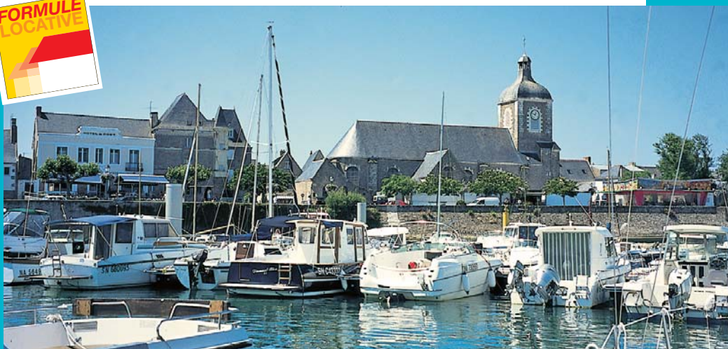
Le port de Piriac, à 7 km