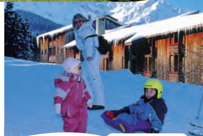
Pied des pistes

Semaines thématiques originales à certaines dates. semaine PASSION Renseignez-vous !