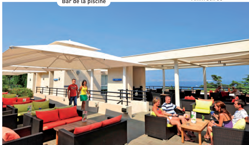
Bar de la piscine