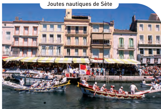
Joutes nautiques de Sète

Pour voir vivre en liberté chevaux, taureaux, des myriades d'oiseaux et découvrir Aigues-Mortes.